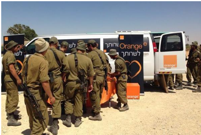
Été 2014 : Orange sponsorise le terrorisme israélien contre la population de Gaza assiégée

Les très nombreuses actions et mobilisations en France contre l'accord de l'entreprise française Orange avec la société de téléphonie mobile israélienne Partner ont permis une 1 ère victoire ! Partner, société raciste implantée en toute illégalité en Palestine occupée et dans le Golan syrien, s'est finalement engagée à cesser d'utiliser la marque Orange à partir de février 2016.