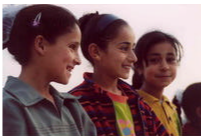
Écolières de Yanoun