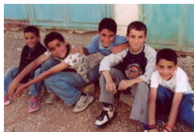
Gamins d'Aqraba, gamins du monde