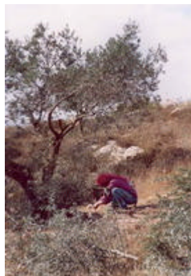
jusqu'à la dernière olive