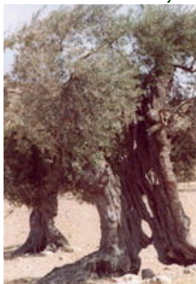
Yanoun - olivier pluriséculaire.