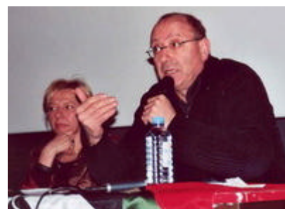
à Lille : Conférence de Nabil El Haggar "De la résistance politique à la résilience culturelle"