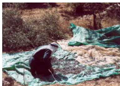
Yanoun tentative de récolte de zitounes