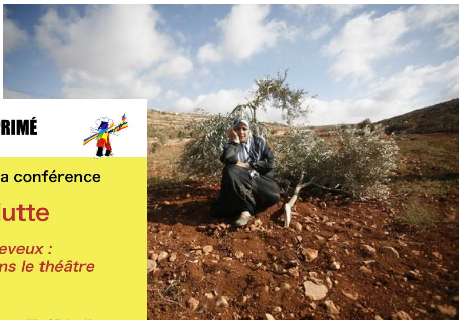
Naplouse après une opération israélienne d'abattage d'oliviers