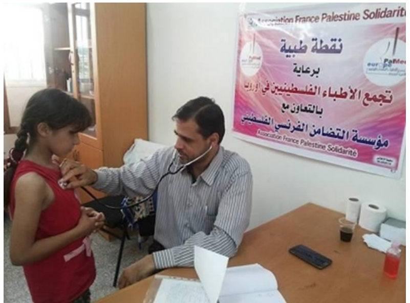
Dans un centre de soins à Gaza

Ce projet humanitaire est le fruit de la coopération entre PalMed-France et l'AFPS 59/62 d'un côté, et entre PalMed-France et Aksahum Humanitaire, de l'autre.