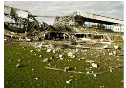
Missiles israéliens sur le stade de football de Gaza.

La politique israélienne a toujours été le nettoyage ethnique de la Palestine. Cela signifie la destruction de toute activité économique, politique, sociale, culturelle et sportive palestinienne.